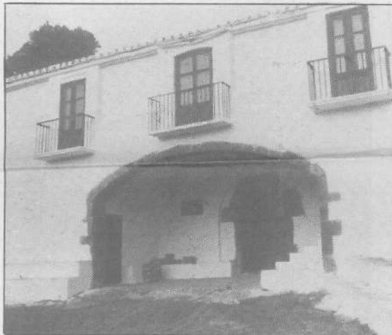
La Magdalena, junto al Castell Vell. Piedras históricas

—Y así concluyó el viaje, ermita tras ermita, paseando por las sendas de la huerta, viajando a través de la historia y de la cultura de nuestro pueblo, en una fecha especialmente significativa el día de Sant Jaume, patrono de la reconquista. No pudimos haber elegido mejor día para visitar las ermitas que superponían la cruz a la media luna.