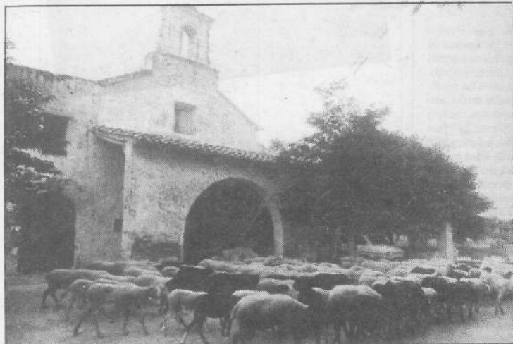
Una bucólica foto de la ermita de San José

Es la ermita más vinculada actualmente al mundo de la labranza, donde en la fiesta del patrón se realiza una tradicional fiesta, siguiendo ineterada costumbre, aunque hay que pensar que los antiguos patronos San Abdón y San Senen, aún presentes en algunos pueblos como Benloch, como "els sants de la pedra", cedieron el pa-