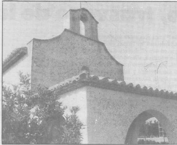
Sant Francesc, donde se conservan interesantes pinturas

Como la mayoría de los edificios ermitaños homónimos, pertenece al siglo XVII, aunque no se ha encontrado documento alguno que hable de la construcción. A mediados del siglo XVIII hay un documento de compraventa en que aparece citada la ermita con su nombre, con ese nombre de antes, de ahora y de siempre.