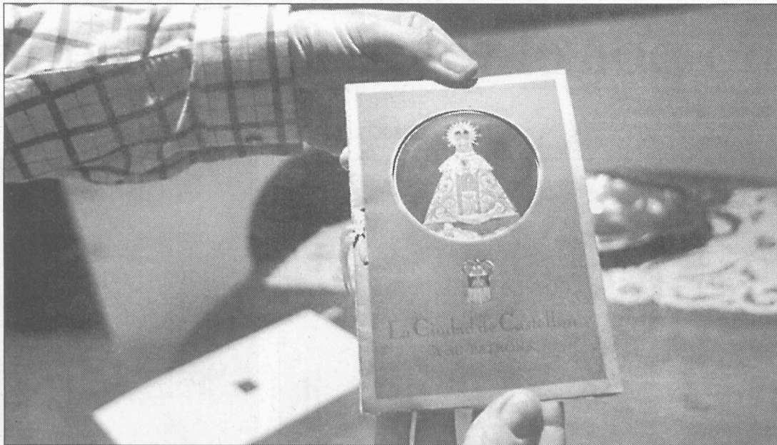
Portada del programa de fiestas de la declaración del patronazgo, de 1923.